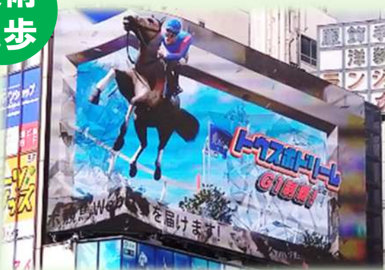
【大型デジタルサイネージ】