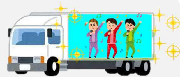
【過度な発光を伴う表示は禁止】