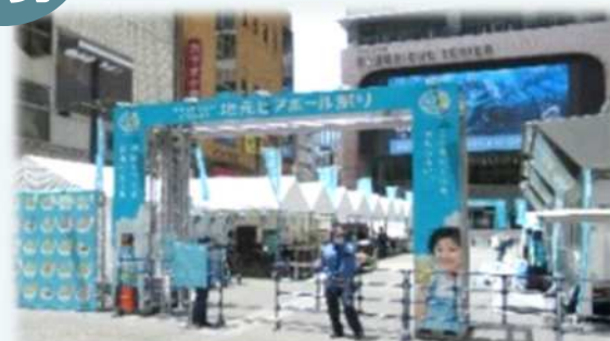
【イベント時の広告物】

エリアマネジメント活動など、民間主体による積極的な地域経営等が行い易くなる仕組みづくりが必要