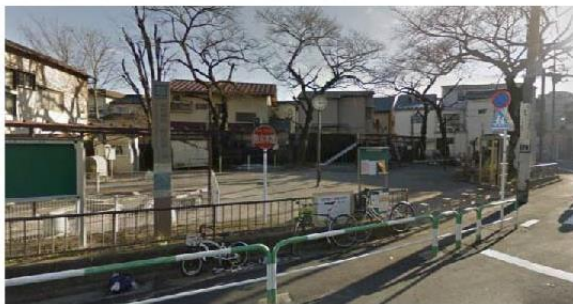
写真④ 区立巢鴨五丁目児童遊園