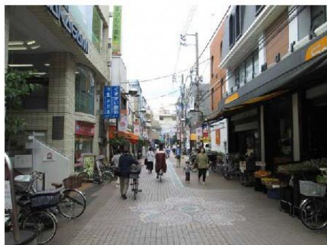
写真⑧ 染井銀座(駒込六丁目)