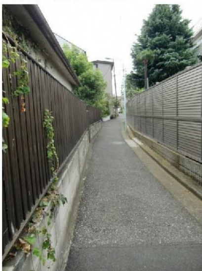
写真③ 防災生活道路