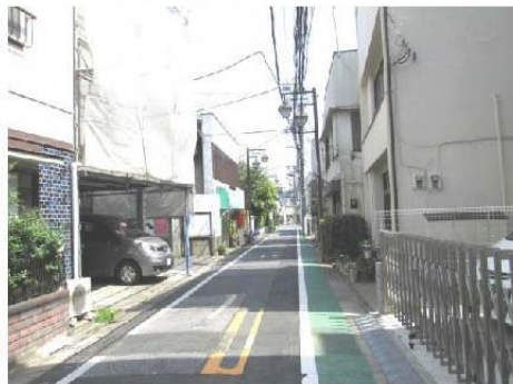
写真① 朝日通り（防災生活道路）