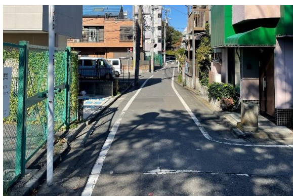
写真⑤ 避難地を結ぶ避難道路（幅員6m拡幅）