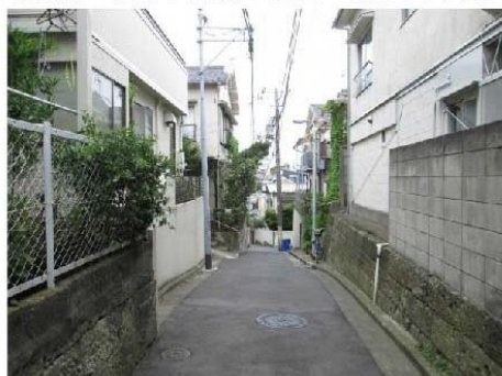
写真⑪ 狭あい道路・坂道 (駒込六丁目)