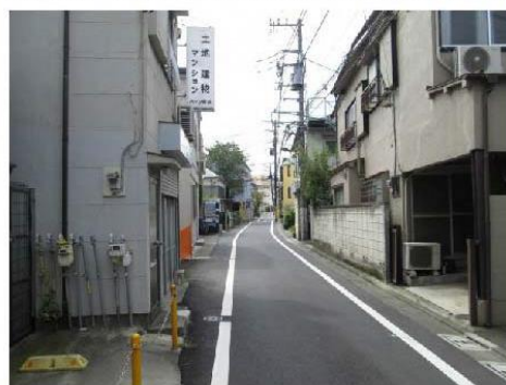
写真⑫ 防災生活道路予定路線(駒込六・七丁目)