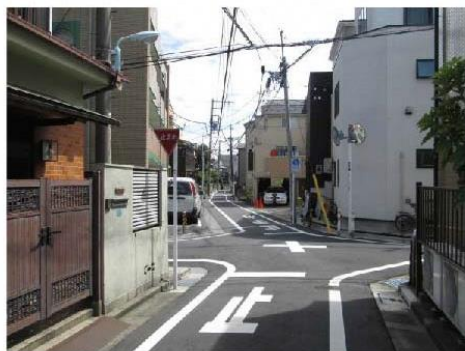
写真⑩ 防災生活道路予定路線(駒込六丁目)