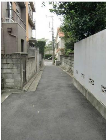
写真② 防災生活道路