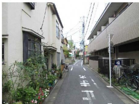
写真⑨ 防災生活道路予定路線(駒込六丁目)