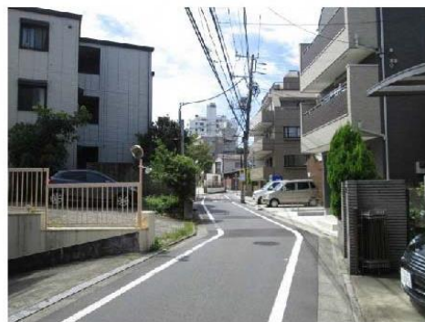
写真⑬ 防災生活道路C路線