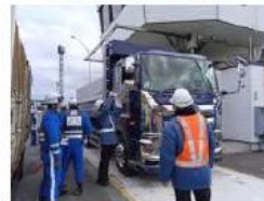
昨年度の車両制限令等取締りに合わせたPRの様子