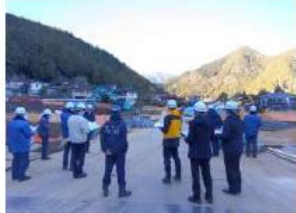
昨年度の合同パトロールの様子