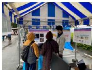
昨年度の日の出町産業まつりの様子