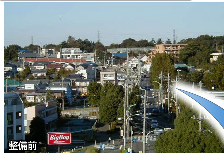
調布3・2・6号 調布保谷線