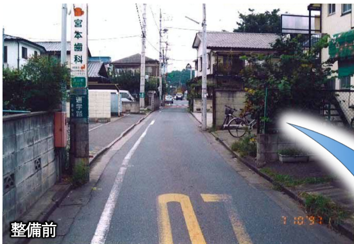
府中3・3・8号 府中所沢線