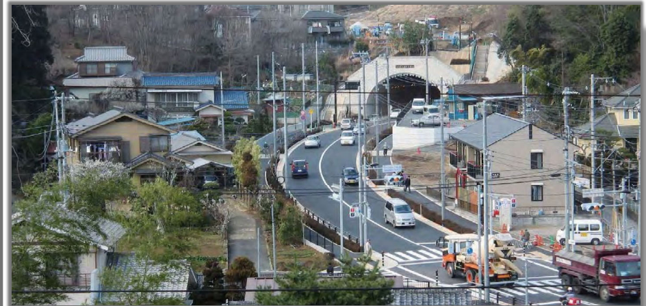
八王子3・4・57号 並木町横川線