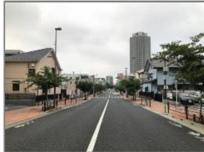
写真は練馬区 区間