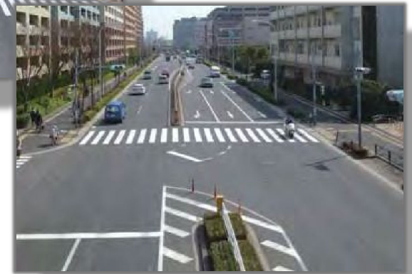
上：清砂大橋 左：江戸川区清新町1丁目付近 右：江東区新砂3丁目付近