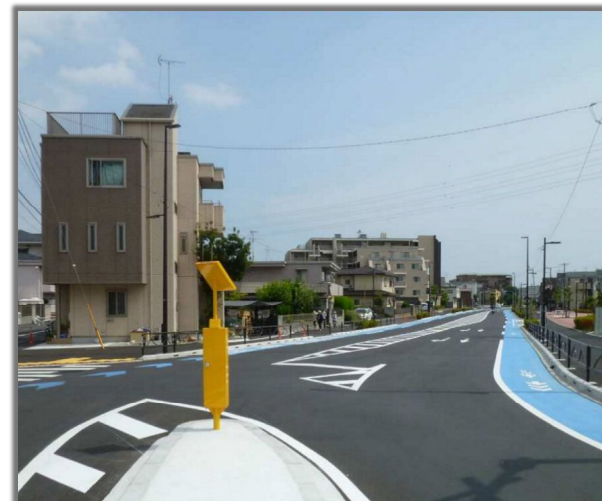
写真は葛飾区 区間