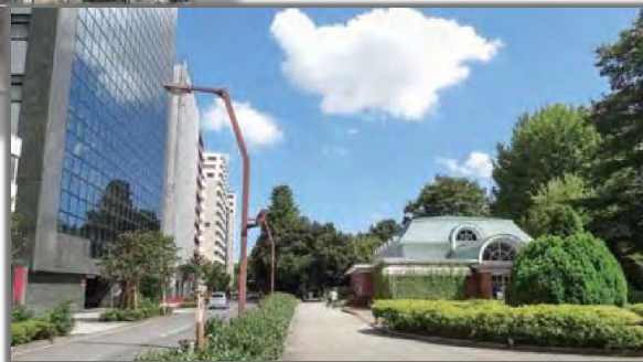
上：新宿御苑トンネル 左：新宿側坑口付近 右：トンネル上部（新宿御苑） 出典：第4回全国街路事業コンクール