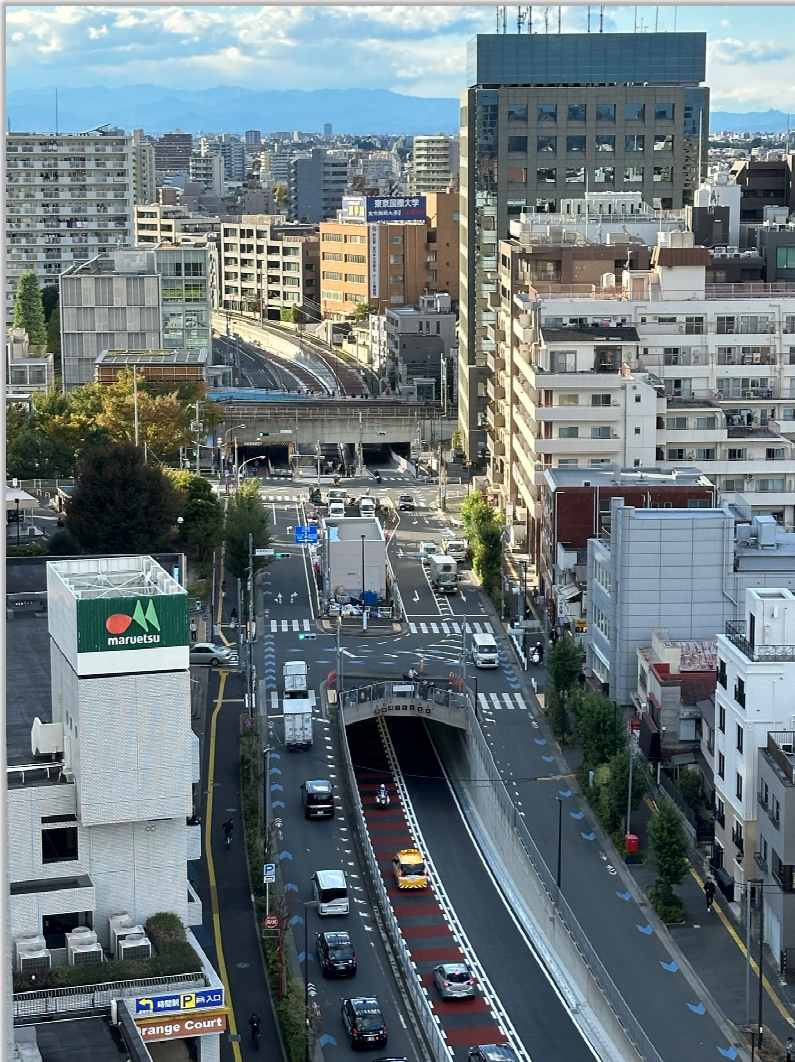
写真は新宿区大久保三丁目から高田馬場四丁目