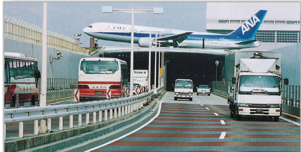
左：北町若木区間（北町若木トンネル） 右上：北町若木区間（板橋相生陸橋） 右下：羽田トンネル