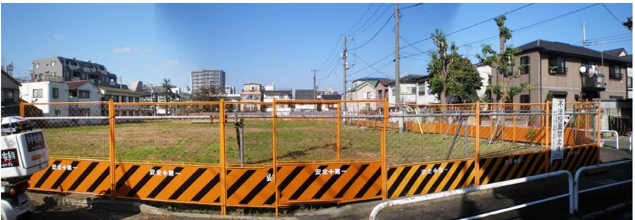
⑪ 都営川島町アパート跡地の様子