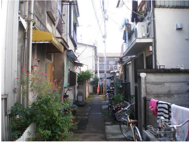
⑫ 街区外側の不燃化が進む中で、建替えの進まない行き止り道路に面した建築物群