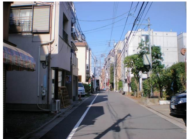
⑥ 区立こぶし公園も面している区画道路2号の様子