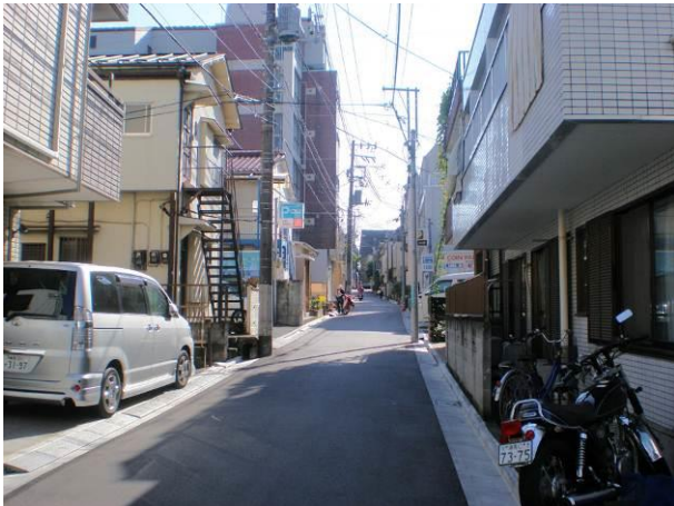
⑨ 不燃建築物と木造建築物の混在する現況幅員 4.4mの区画道路8号の様子