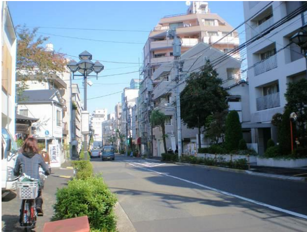
③ 不燃建築物と木造建築物の混在する地区集散道路である柳通り