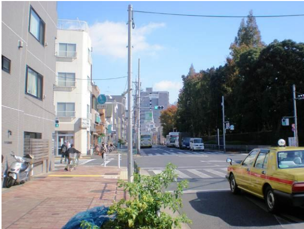
① 補助62号線整備の進む方南通りと、広域避難場所の東京大学附属中等教育学校(右側樹木内)