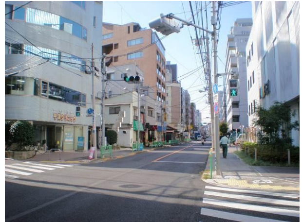
② 補助63号線は未整備でも、沿道不燃化の進んでいる本郷通り