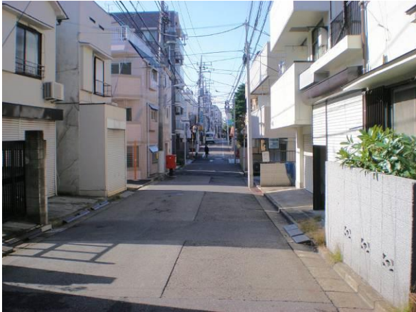
⑦ 木造住宅も数多く建ち並んでいる区画道路7号 (現況幅員 4.2~5.4m)の様子