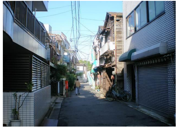
⑮ 不燃化が進む中であって、所々に点在する狭あい道路を前面道路とする裸木造の建築物