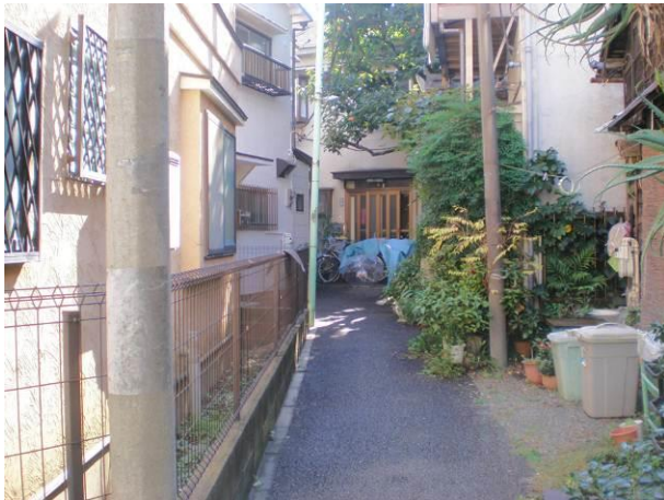
⑭ 道路種別上は認定外道路で、建替えに際して問題となる街区奥の建築物