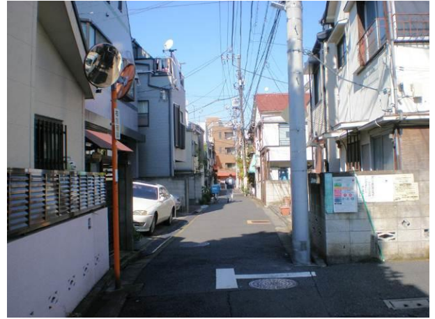
⑬ 方南通りと川島商店街を結ぶ現道幅員 3.0～3.7mの区画道路1号の様子