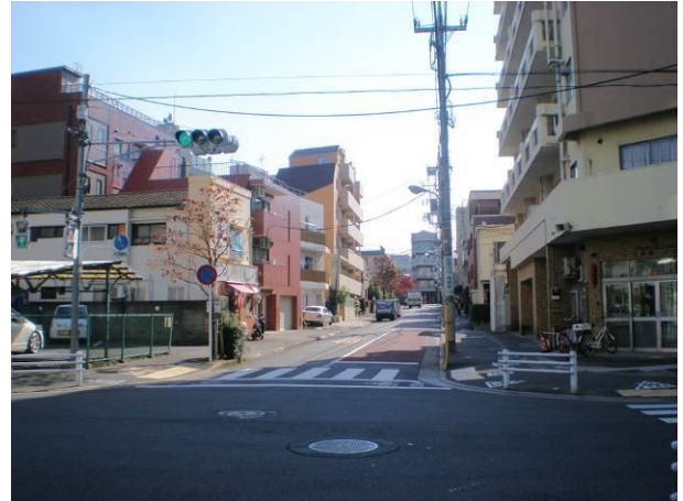
⑧ 10mの道路幅員を有し、マンション等の耐火 建築物の建ち並ぶ区画道路9号の様子