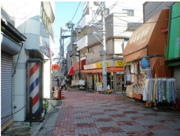
⑤ 木造の住商併用建築物も多く残る川島通り(区画道路4号)