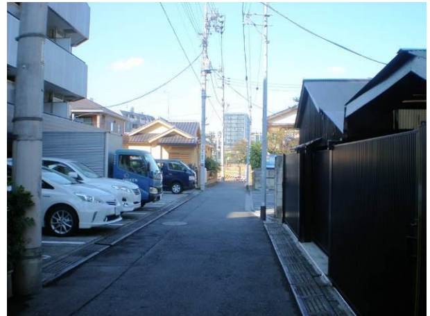
⑩ 川島商店街通り(区画道路3号)と都営川島町ア パート跡地を結ぶ区画道路5号の様子