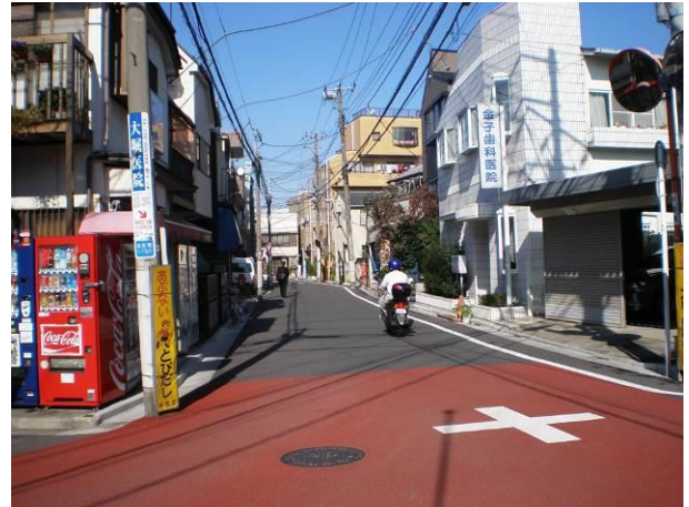
④ 地区東部の境界線にあたる区画道路3号の沿道