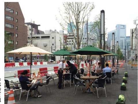
新たに設置したオープンカフェ