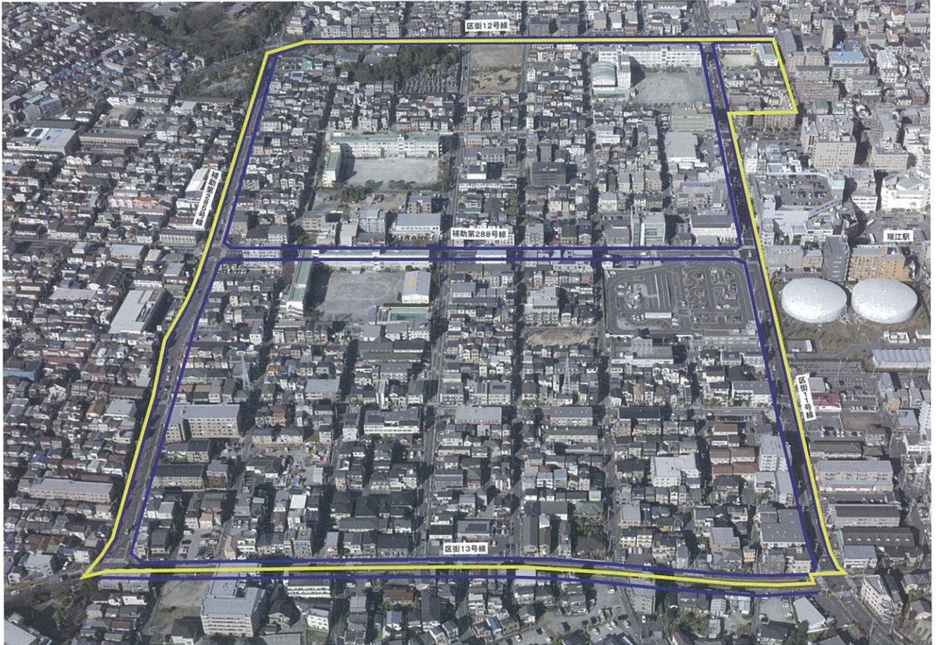
瑞江駅西部地区（平成29年12月撮影）

登録番号 (30) 6 平成31年1月21日 おしらせNo.39 発行 東京都第一市街地整備事務所 〒104-0054 中央区勝どき1-7-3 電話 03(3534)3405 第一市街地整備事務所ホームページ http://www.toshiseibi.metro.tokyo.jp/daiichiseibi/index.html