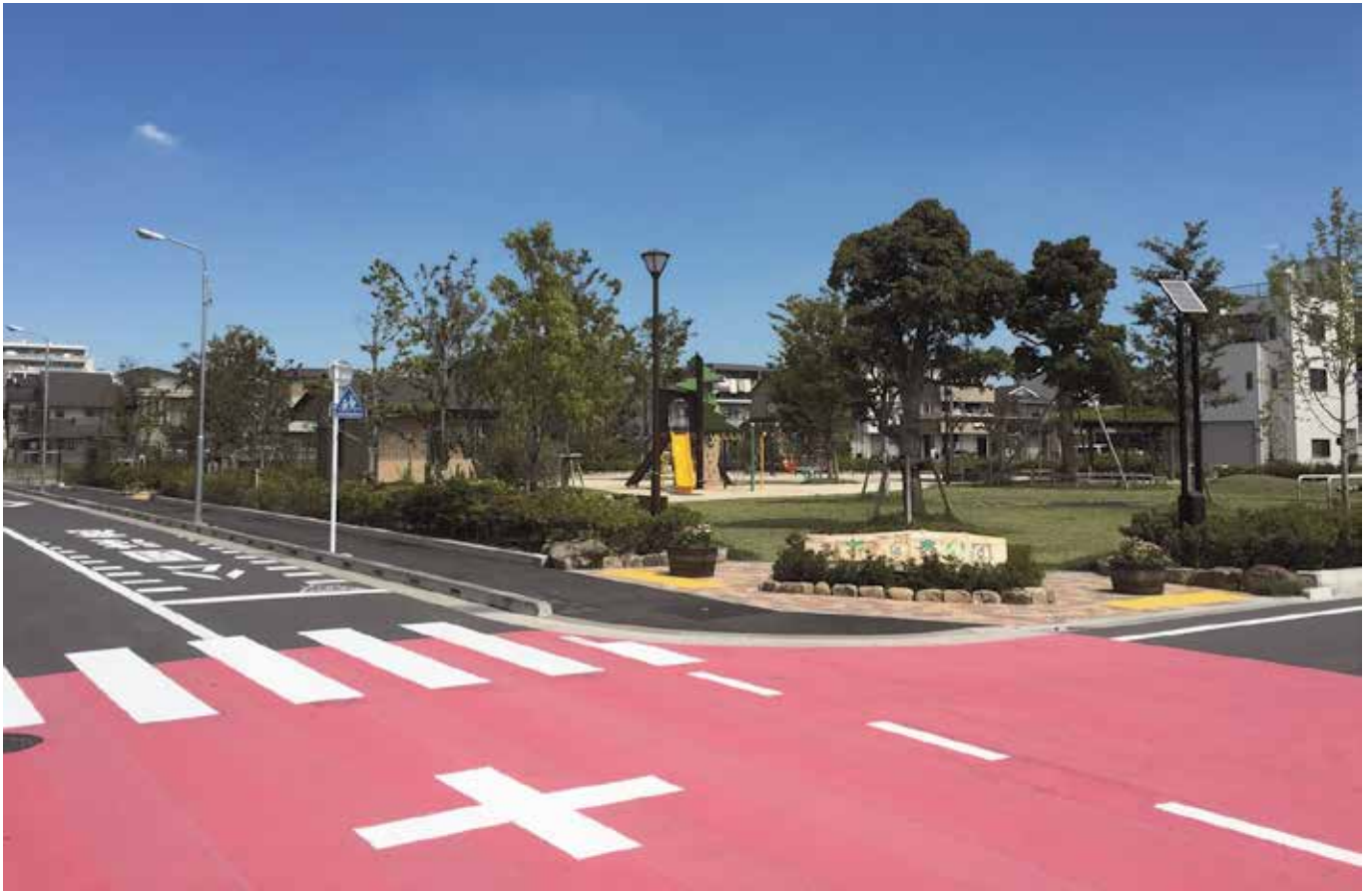
電線類が地中化され、周辺道路の整備が進んだみずえの森公園（平成29年8月撮影）

登録番号 (29) 2 平成 29 年 9 月 12 日 おしらせ No.38 発行 東京都第一市街地整備事務所 〒104-0054 中央区勝どき 1-7-3 電話 03 (3534) 3405 第一市街地整備事務所ホームページ http://www.toshiseibi.metro.tokyo.jp/daiichiseibi/index.html