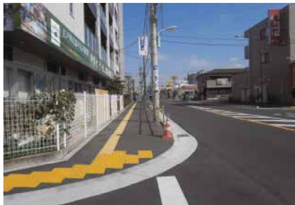
区街13号線側から瑞江駅方向（平成29年7月撮影）