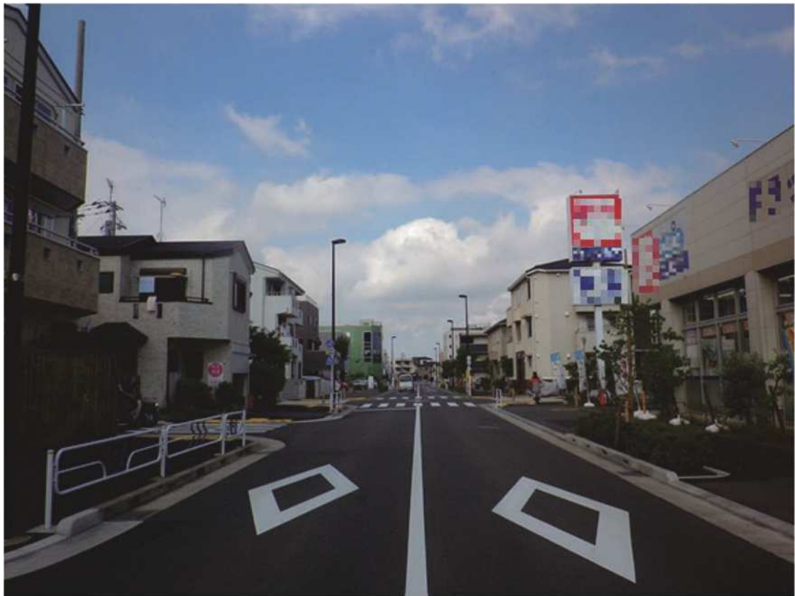
江戸川区街 23 号線