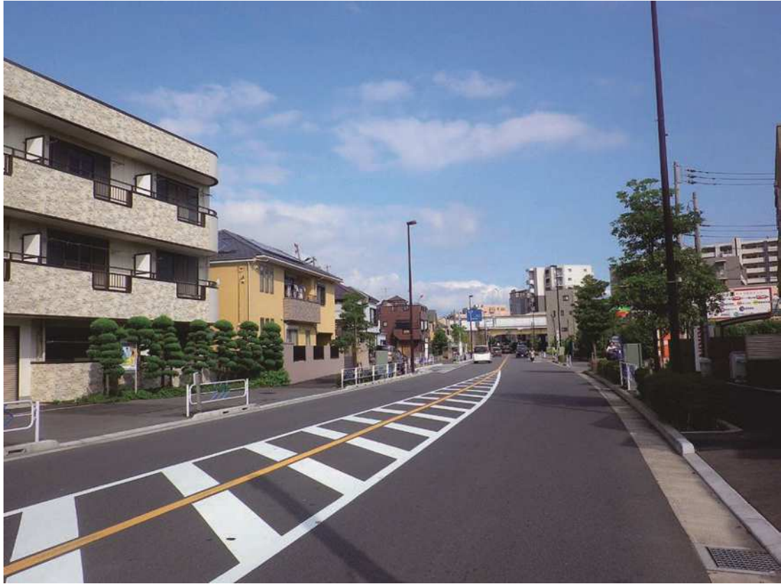
江戸川区街 22 号線