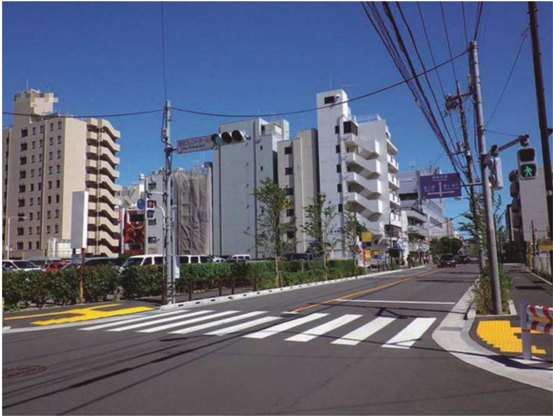
江戸川区街 11 号線