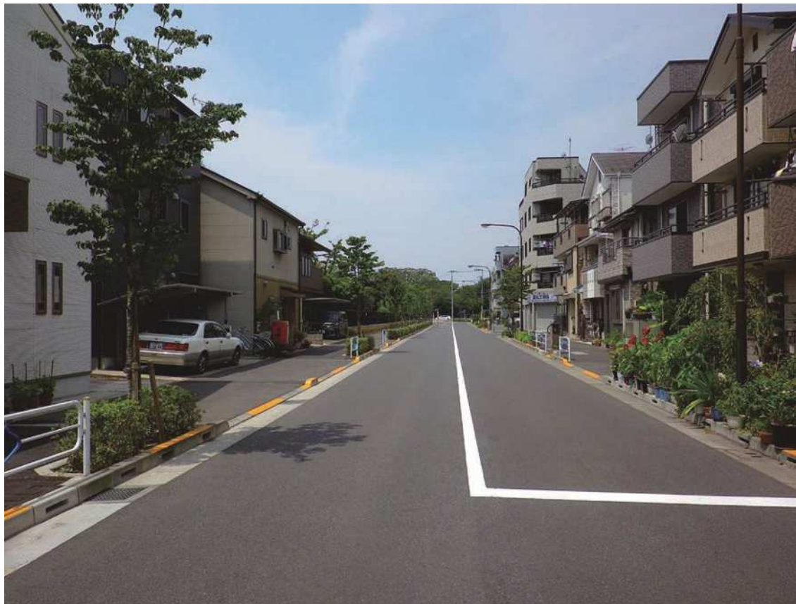
江戸川区街 12 号線