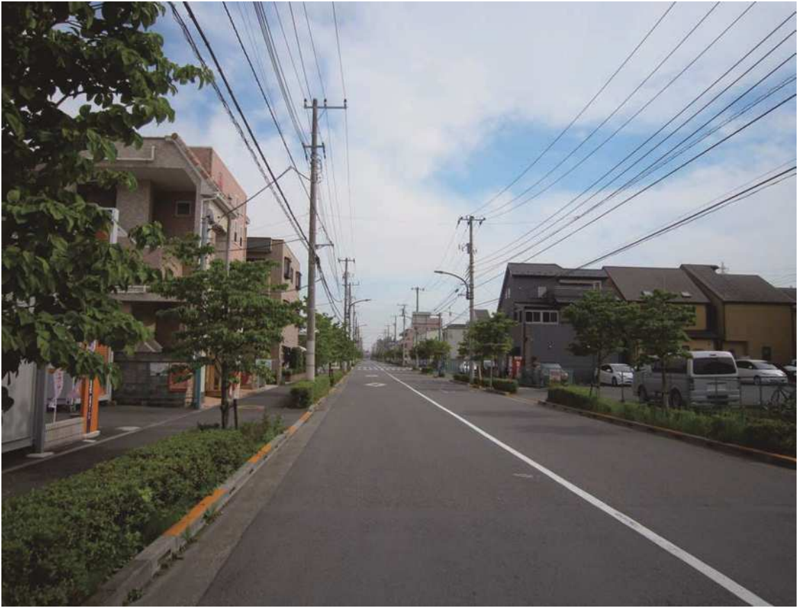
補助第 257 号線