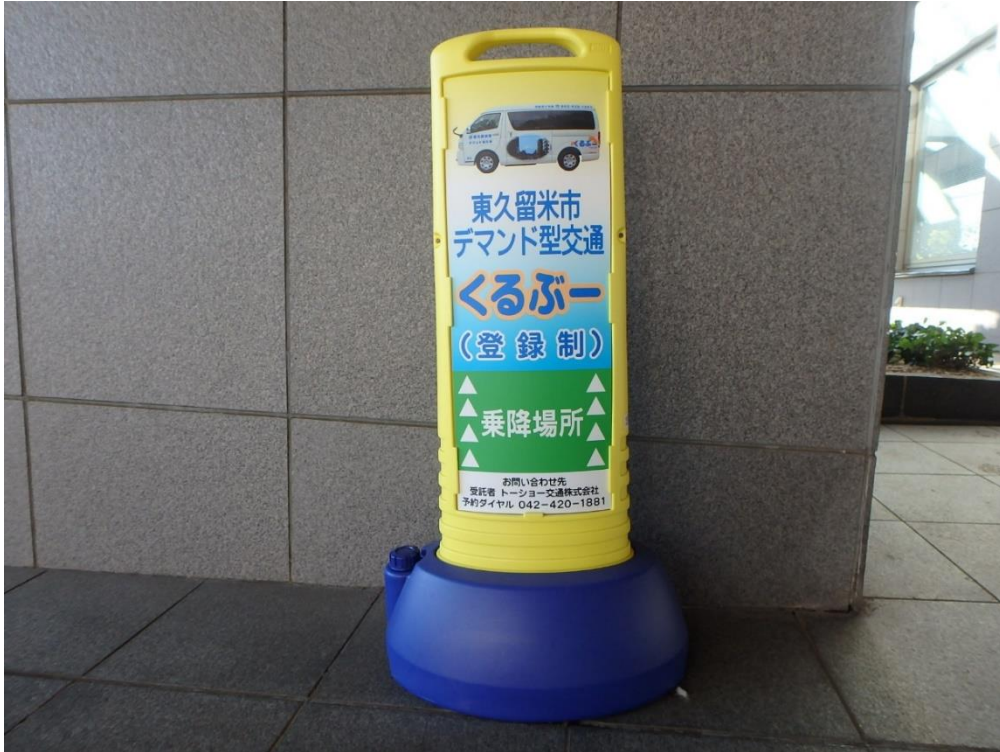
▶ 乗降場所を示すサインキューブ