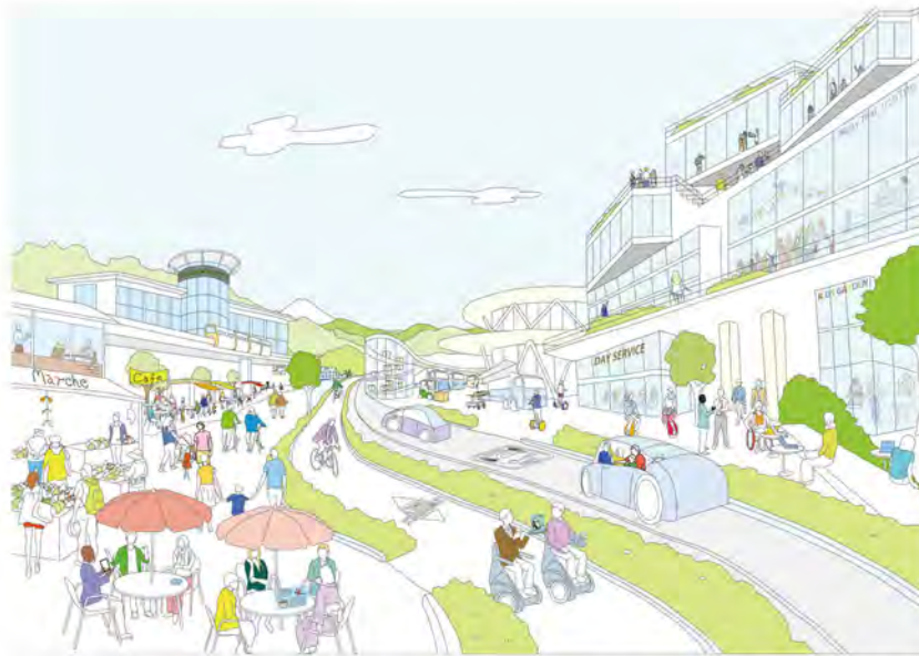
若い留学生や研究者たちが集まり、イノベーションが生まれる多摩地域 (出典) 東京都「都市づくりのグランドデザイン (平成29年9月)」 *4 (P5)

東京の復興に当たっては、強靱なインフラストックなどを最大限活用して、「安全でゆとりある都市」に高度な都市機能を集積し、更にそれを伸ばし、グローバルな人・モノ・情報の活発な交流を促進する。これにより、新たな価値を生み続ける活動の舞台としての東京のブランド力をより一層高めることで、世界中の人から選択される都市を目指す。