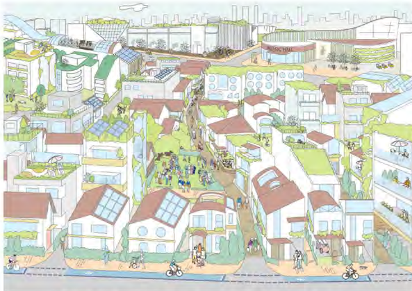
木造住宅密集地域が解消された魅力的な住宅市街地 *4

被災地域を中心として、耐震性等を有する建築物の整備促進や、道路、河川などの整備はもとより、地域のコミュニティを育み、災害発生時には防災活動拠点にもなる公園等のオープンスペースの確保や有効活用を図る。加えて、生活や業務等の継続に必要なエネルギーが安定供給できるエネルギーインフラの整備を促進する。これらにより、強靱な都市施設や建築物を形成することで、被災を繰り返さない、安全でゆとりある都市を目指す。