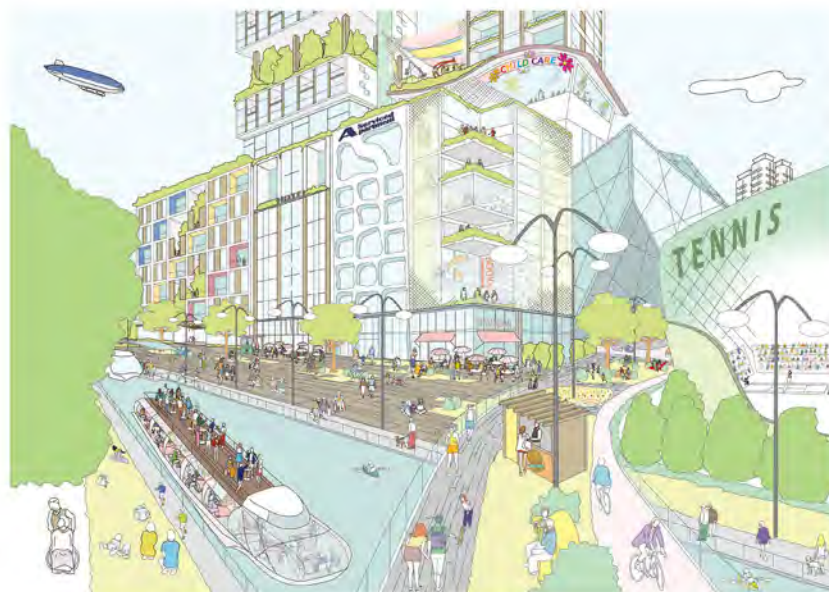
質の高い居住環境が充実した区部中心部