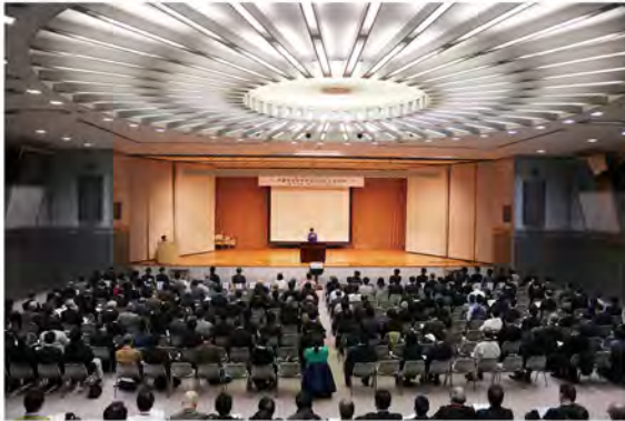
都民参加型「震災復興シンポジウム」

「都市復興の理念、目標及び基本方針」や「東京都震災復興マニュアル」について、都民等と共有を図るため、毎年、都の行事などを通じて普及啓発に取り組んでいる。