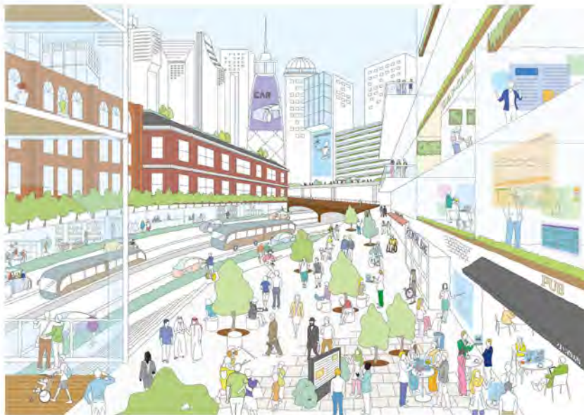
国際的なビジネス活動が繰り広げられている区部中心部

この目標は、東京が持続的に発展していくために、日本はもとより世界をリードする都市として更なる成長を遂げ、世界中の誰もが憧れ、希望と活力があふれる成熟した都市を目指すという決意を示すものである。