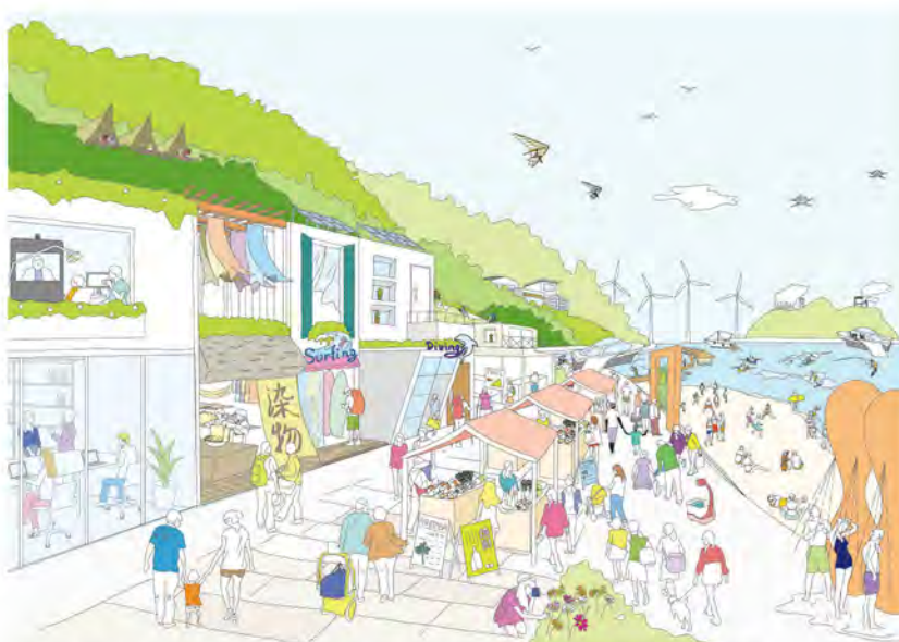
磨き上げられた宝物を楽しむ多くの人でにぎわう島しょ部