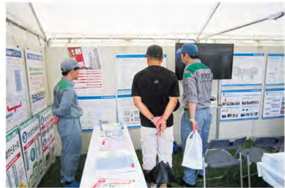
総合防災訓練・防災展等で展示

さらに、平成31年度から、民間団体や区市町村による、都民等が都市復興プロセスを学ぶセミナー、ワークショップ等の開催を支援するため、補助制度（地域協働復興の普及啓発事業）も創設し、活用が始まっている。