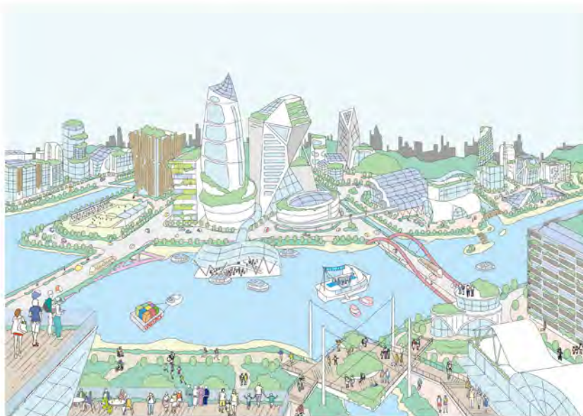
水と緑がネットワーク化された潤いあふれる区部中心部

東京の復興に当たっては、最先端技術も活用しながら、長期的な観点から、環境への配慮 (Environment)、社会への貢献 (Social)、都市のマネジメント (Governance)、いわゆる「ESG *5 」の概念を取り入れて都市づくりを進める。あわせて、みどりを守り、まちを守り、人を守るとともに、東京ならではの価値を高める。これらにより、持続的な発展を遂げる都市・東京を目指す。