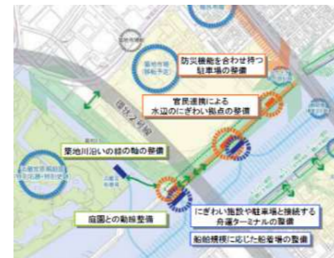
隅田川等における新たな水辺整備のあり方 (H26.2) より抜粋