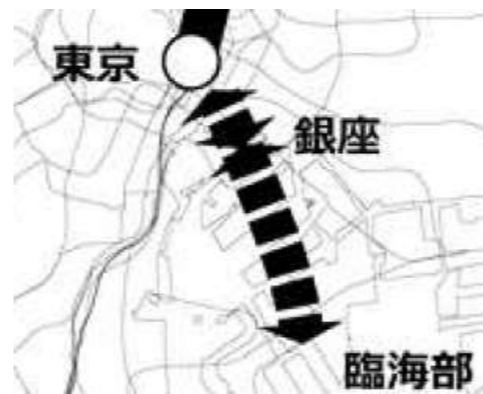
東京圏における今後の都市鉄道のあり方について（答申）/H28.4.20より抜粋