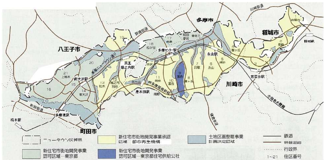
図表1-3 多摩ニュータウンの整備手法と実施主体