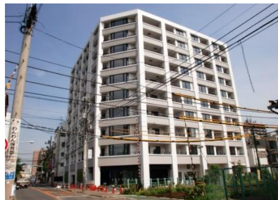
建物の共同化の事例（東池袋地区）