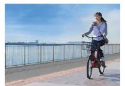
コミュニティサイクル