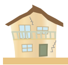
除却する老朽建築物

老朽建築物を、一定の要件を満たす耐火建築物又は準耐火建築物に建替える場合、除却費（最大 160 万円）と建築設計費等（耐火建築物は最大 90 万円）を助成します。