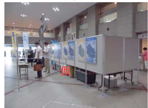
※ パネル展の様子 (区役所1階にて)