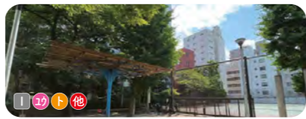
4 田原公園 田原小学校に隣接する。イチヨウやタイサンボクが植えられている。 ● 1,798 m 2 ● 1931年開設 ● 雷門 1-5-15