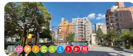
10 山伏公園 駒形中学校に隣接する。複合遊具、ミスト遊具、スポーツコーナーがある。南西側出入口にあるウメがきれいに咲く。 ● 1,461 m 2 ● 1931年開設 ● 北上野 2-9-7