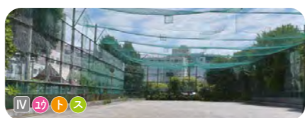
6 玉姫公園 福祉プラザ台東清峰会に隣接する。大きなスポーツコーナーがある。 ● 3,504 m 2 ● 1930年開設 ● 清川 2-13-18

小学校との位置関係 I 校庭に隣接 II 校舎に隣接 III 道路が介在 IV その他 公園内の施設 1 遊具 2 健康遊具 3 休憩舎 4 トイレ 5 広場 6 スポーツ場 7 壁泉 8 池流れ・噴水 9 じゃぶじゃぶ池 10 ミスト 11 ピオトープ 12 モノモメントオブジェ 13 防災トイレ 14 かまどベンチ等 15 防災井戸 16 ソーラー照明灯 17 その他防災施設