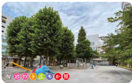
3 西町公園 永寿総合病院に隣接する。大きな樹木が多く、ミカンやカキなどの果樹が植えられている。かつて隣接した旧西町小学校の碑が残っている。 ● 2,936 m 2 ● 1930年開設 ● 東上野 2-23-3