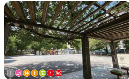
8 千束公園 千束小学校に隣接する。複合遊具や広場がある。大きなイチヨウが植えられている。 ● 2,221 m 2 ● 1930年開設 ● 浅草 4-24-7