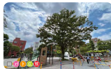
11 富士公園 富士小学校に隣接する。富士山の形をしたトイレがある。大きなケヤキが植えられている。 ● 2,406 m 2 ● 1931年開設 ● 浅草 4-47-2