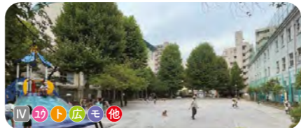
5 柳北公園 柳北スポーツプラザに隣接する。複合遊具や広場がある。大きなスズカケノキが多く植えられている。 ● 2,982 m 2 ● 1926年開設 ● 浅草橋 5-1-35