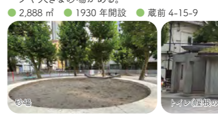
13 金杉公園(旧入谷公園) 柏葉中学校に隣接する。クジラや機関車等のオリジナル遊具が多く、スポーツコーナーやクライミングウォールもある。 ● 1,679 m 2 ● 1931年開設 ● 下谷 3-5-12