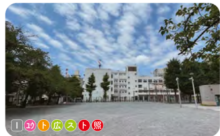
1 東盛公園 東泉小学校に隣接する。大きな広場、フェンスで囲まれた遊び場、スポーツコーナーがある。 ● 3,777 m 2 ● 1928年開設 ● 三ノ輪 1-23-2

改修においては、住民との話し合いのもと、防災トイレやかまどベンチ、防災井戸等の設置による防災機能の強化を図っている。また、精華公園でのピオトープの設置やトイレの屋根の緑化による生物多様性への配慮、暑熱対策としてミスト遊具の設置(御徒町公園、山伏公園)、ボール遊びができるスポーツコーナーの設置(東盛公園、玉姫公園、山伏公園、金杉公園)等、新たなニーズへの対応に取り組んでいる。