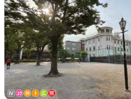
15 金竜公園 生涯学習センターに隣接する。複合遊具や半円形の日陰棚がある。メタセコイヤが植えられている。 ● 2,645 m 2 ● 1931年開設 ● 西浅草 3-25-7