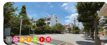
9 石浜公園 石浜小学校に隣接する。日時計、石の浜をかたどった砂場、平賀源内のエレキテルをモチーフにしたトイレがある。 ● 2,972 m 2 ● 1930年開設 ● 清川 1-14-21