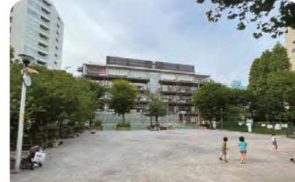
12 精華公園 蔵前小学校に隣接する。自然観察のできるピオトープや大きな砂場がある。 ● 2,888 m 2 ● 1930年開設 ● 蔵前 4-15-9