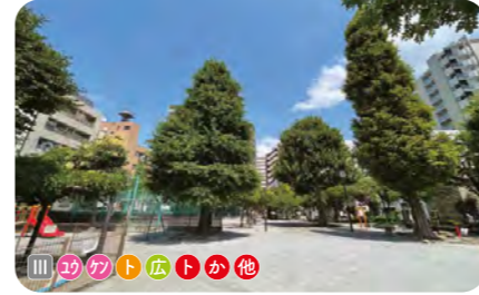
7 松葉公園 松葉小学校に隣接する。大きな複合遊具や広場がある。和風な植込地には竹林がある。 ● 2,972 m 2 ● 1931年開設 ● 松が谷 1-12-6

小学校との位置関係 I 校庭に隣接 II 校舎に隣接 III 道路が介在 IV その他 公園内の施設 1 遊具 2 健康遊具 3 休憩舎 4 トイレ 5 広場 6 スポーツ場 7 壁泉 8 池流れ・噴水 9 じゃぶじゃぶ池 10 ミスト 11 ピオトープ 12 モノモメントオブジェ 13 防災トイレ 14 かまどベンチ等 15 防災井戸 16 ソーラー照明灯 17 その他防災施設