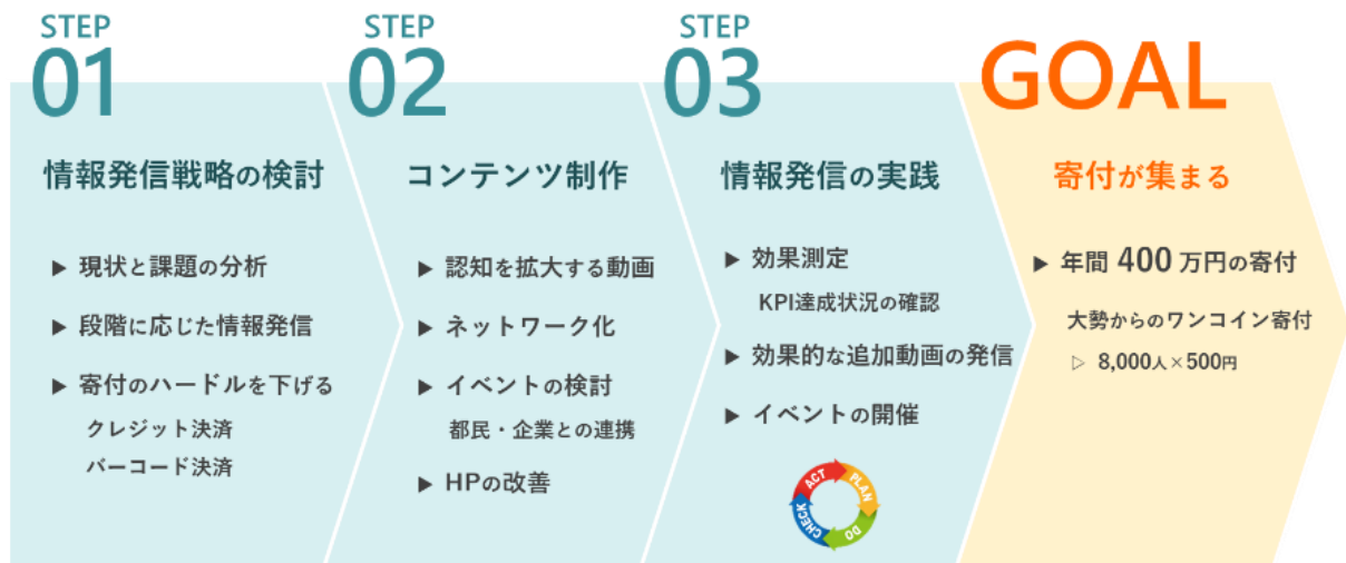
図4 「社会全体で都選定を守り支える仕組みづくり」のロードマップ

次に、都選定の新たな魅力を発信するための整理として、様々なテーマで都選定を分類する試みを進めた。受託者とのディスカッションの中で、12のテーマを設定し、その中でも特に反響が大きいと思われる3案について、訪問ルート等の具体的な検討を進めた。