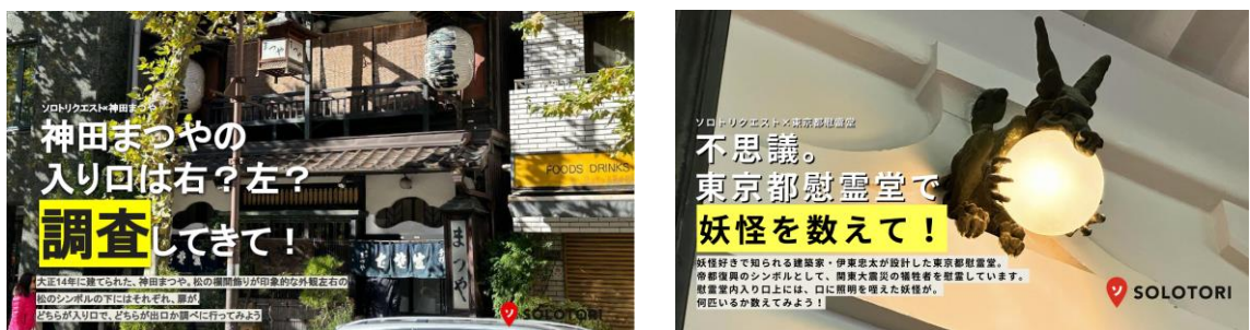
図6 歴史的建造物クエスト（仮）の案

令和5年12月から、「歴史的建造物クエスト（仮）」（図6）によるファンづくりと寄付額増加を目指し、スタートアップとの協働を開始している。